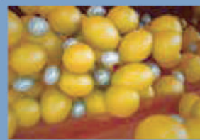
Proceso metabólico (30 días)

Las células de grasa en el área comienzan a responder con Crío-cristalización.