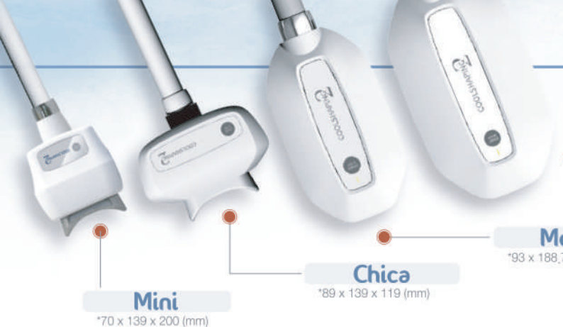
Mini *70 x 139 x 200 (mm)