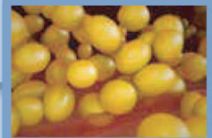
Células eliminadas (90 días)

Posteriormente, las células de grasa alcanzan una muerte biológica y son removidas del organismo por medio del proceso metabólico natural.