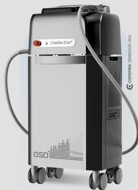
Coolite Evo ES