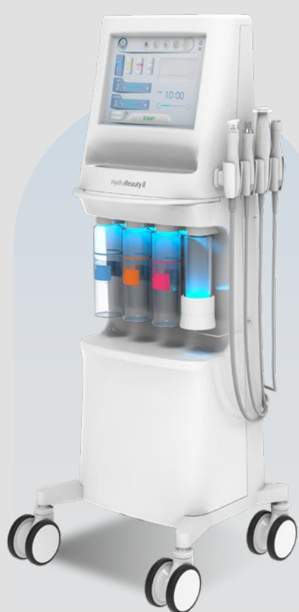
Hydra Beauty 2