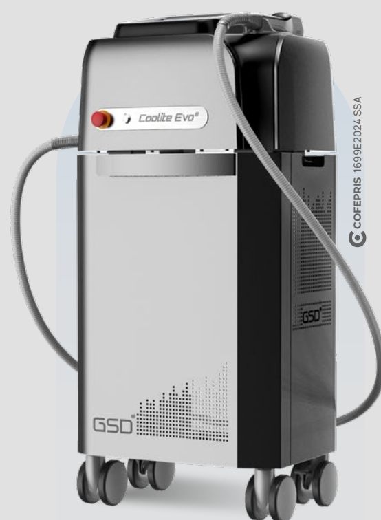
Coolite Evo ®

SISTEMA MULTIFUNCIONAL DE MODELADO COPORAL