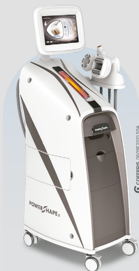
POWER SHAPE 2™

Radiofrecuencia + Vacuum + Láser de Bajo Nivel