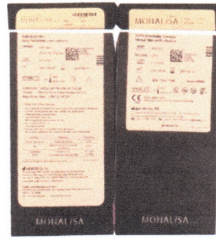
Comparativa de Etiquetas.