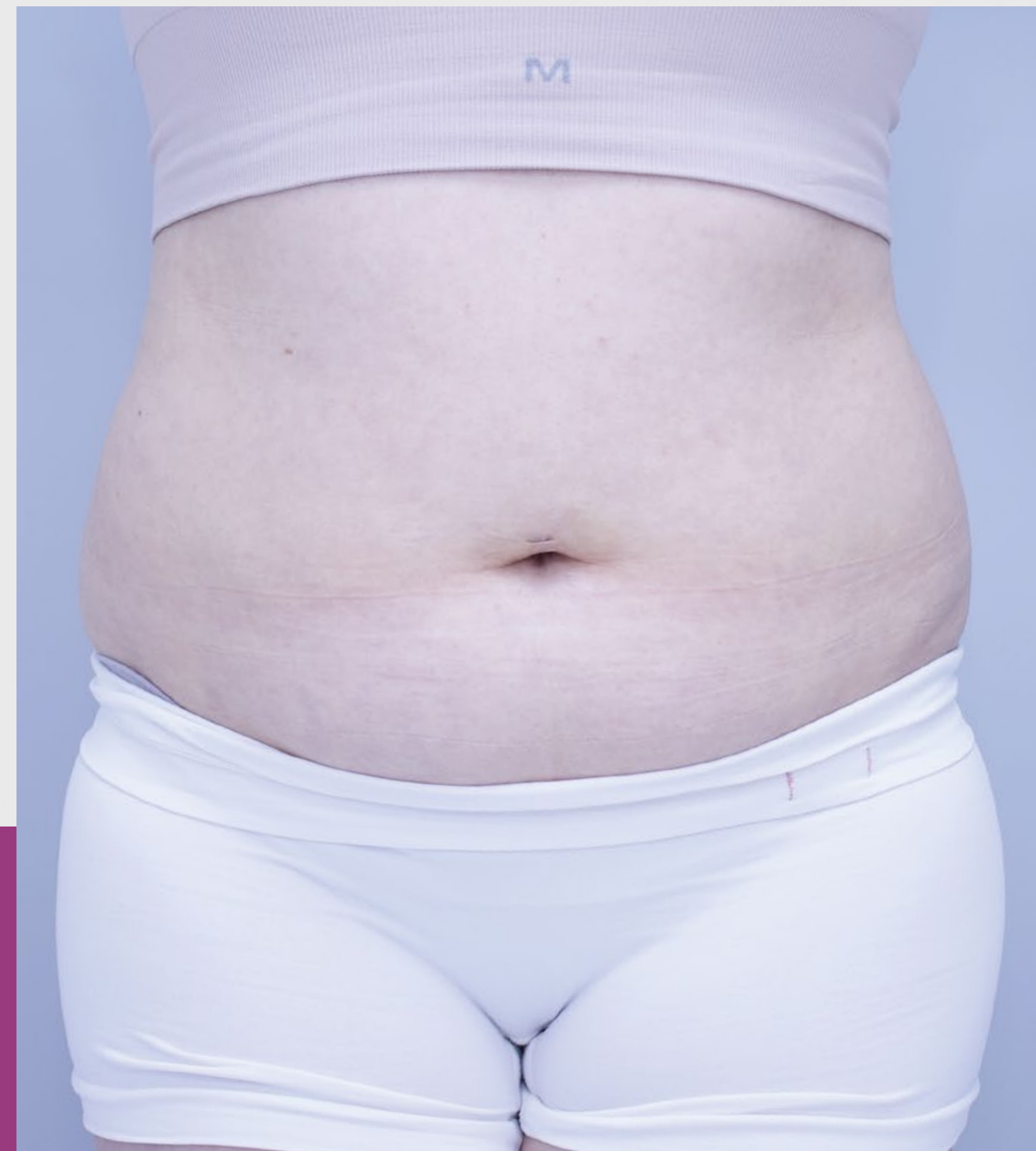
10 SESIONES DESPUÉS