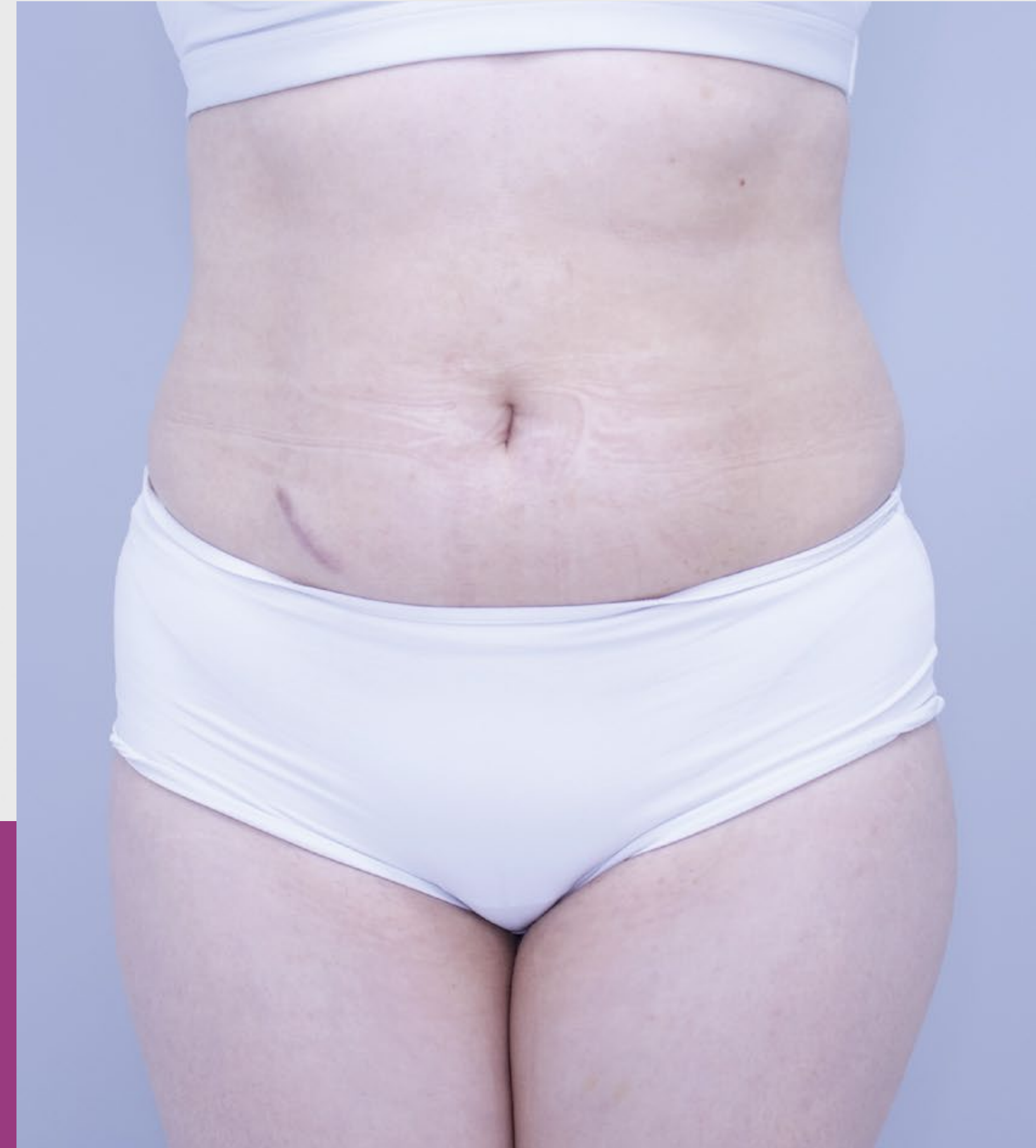
10 SESIONES DESPUÉS