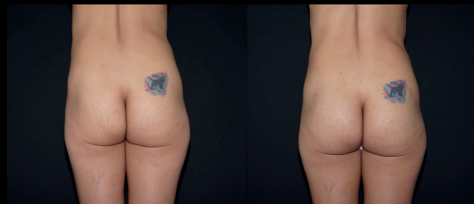
Antes | Después