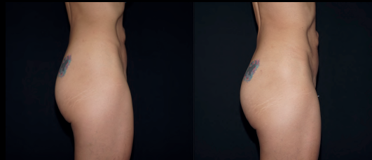
Antes | Después